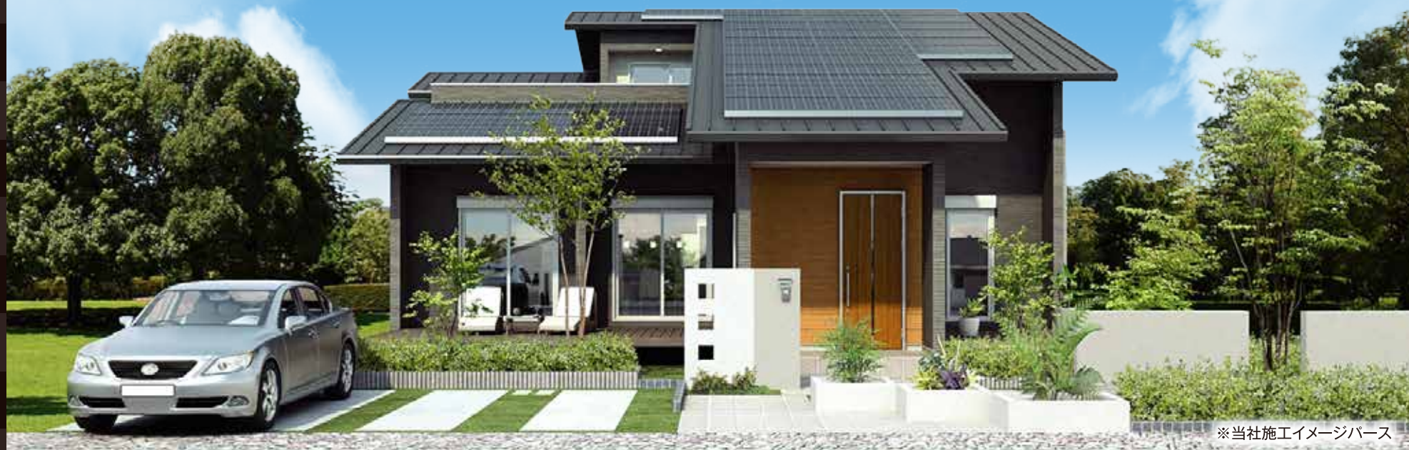
※当社施工イメージパース