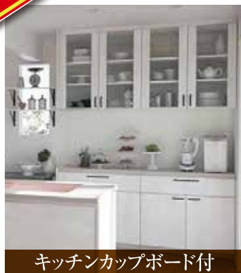
キッチンカップボード付