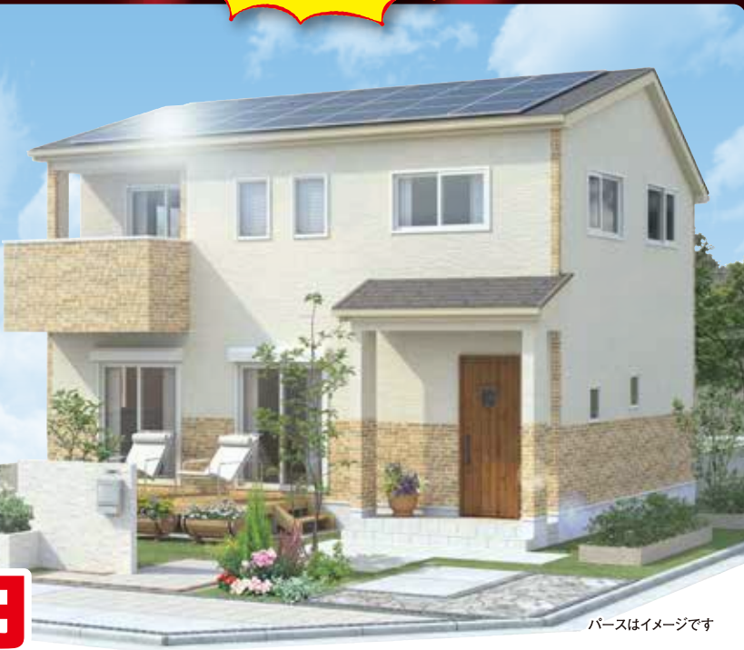
パースはイメージです

※数値は目安であり、それを保証するものではありません。実際の気象条件や設置条件、プラン、敷地環境等により発電量、売電収入額は異なります。