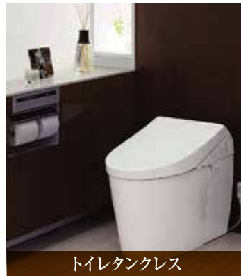
トイレタンクレス