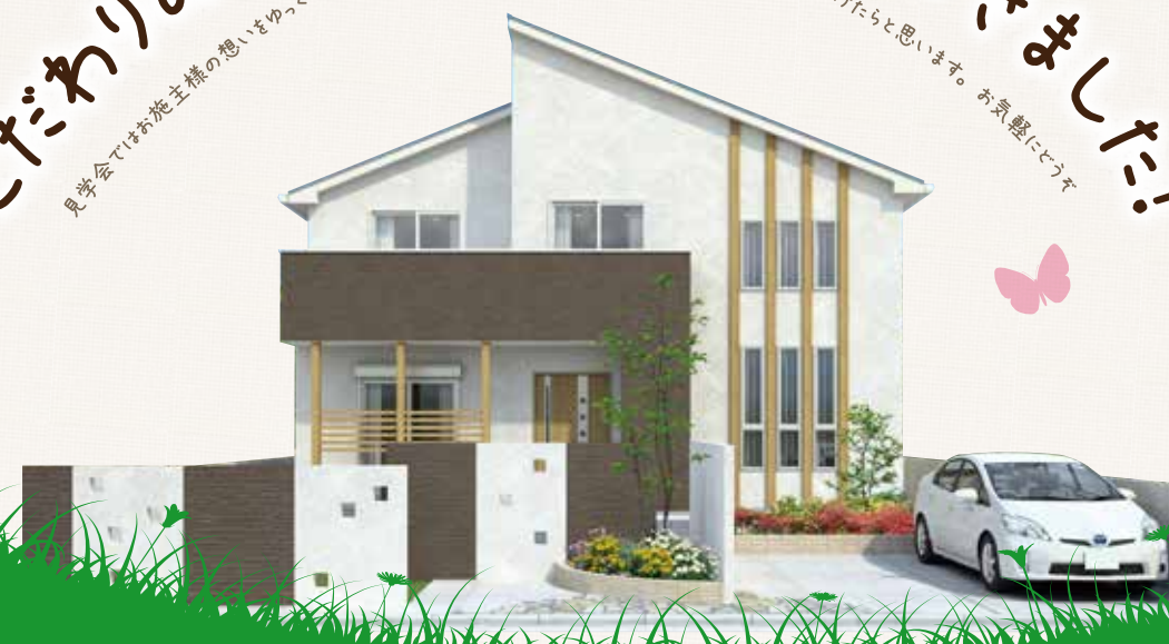
※画像はすべてイメージです。今回の見学会のお宅とは異なります。