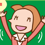
お子様を 見守りながら商談 いただけます