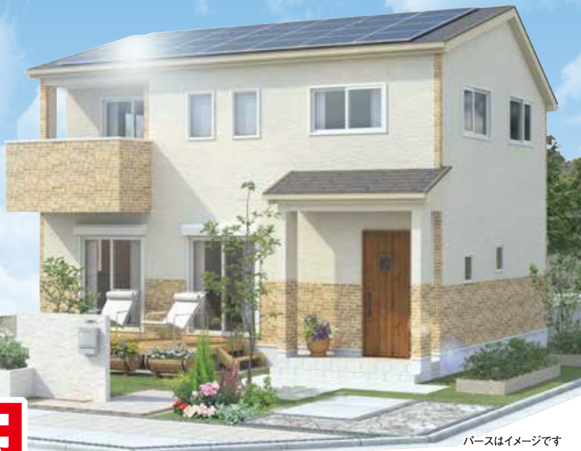
パースはイメージです

※数値は目安であり、それを保証するものではありません。実際の気象条件や設置条件、プラン、敷地環境等により発電量、売電収入額は異なります。