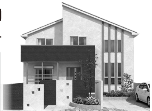
※画像はすべてイメージです。今回の見学会のお宅とは異なります。