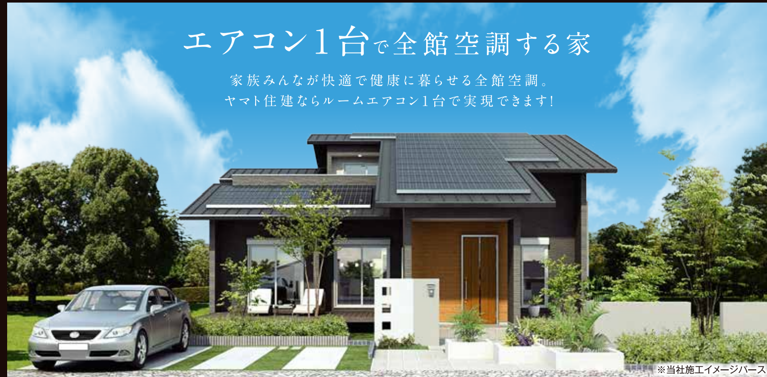
※当社施工イメージベース

家族みんなが快適で健康に暮らせる全館空調。 ヤマト建建ならルームエアコン1台で実現できます!