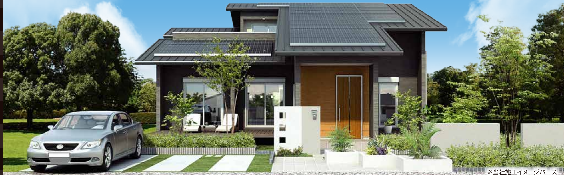
※当社施工イメージパース