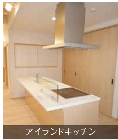
アイランドキッチン