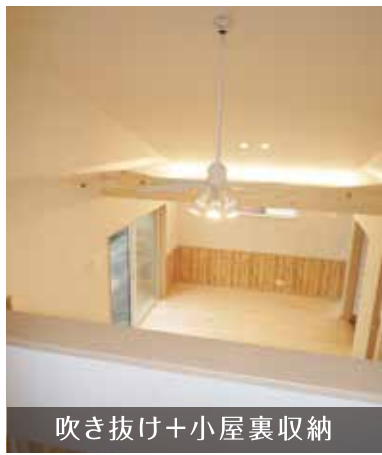
吹き抜け+小屋裏収納