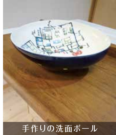
手作りの洗面ボール