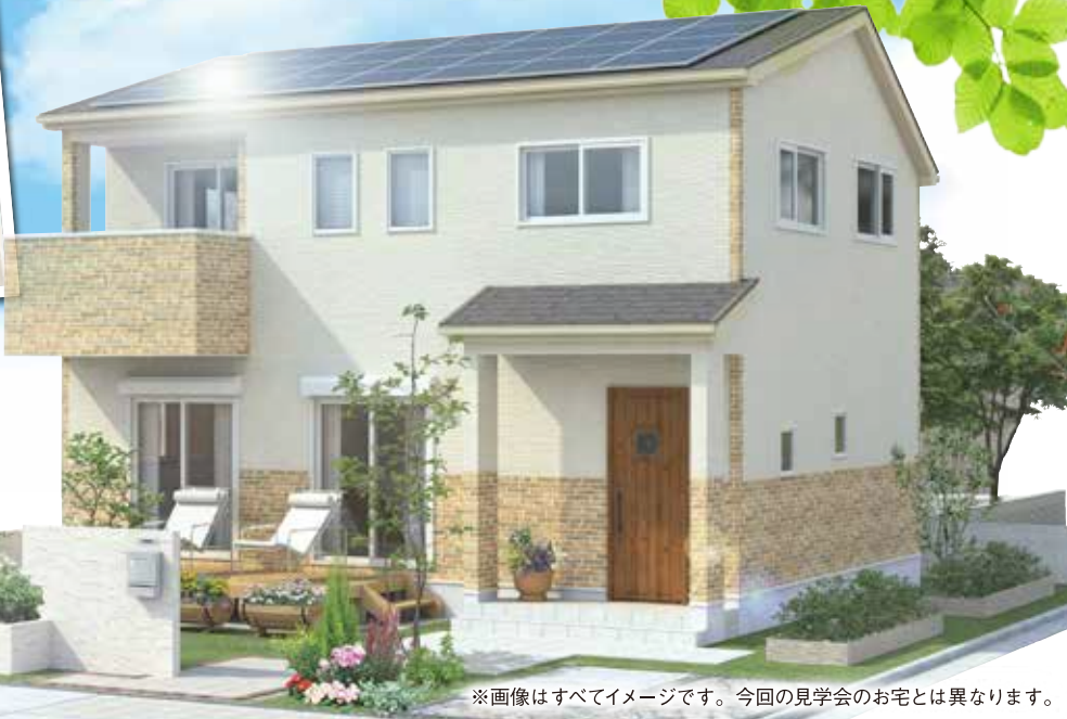
※画像はすべてイメージです。今回の見学会のお宅とは異なります。