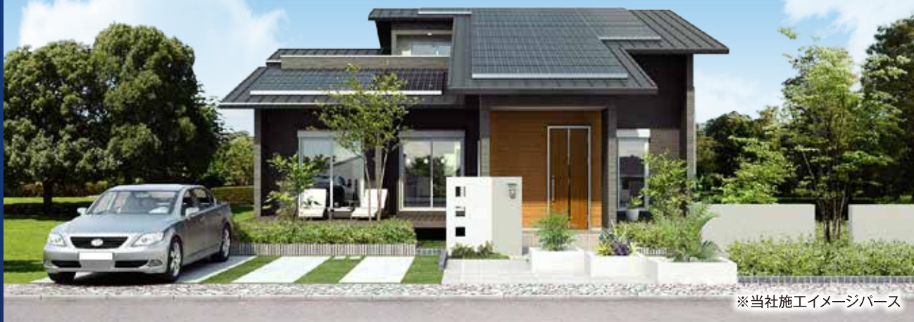
※当社施工イメージバス

ヤマト住建の高気密・高断熱だから 可能なエアコン1台で全館空調する 画期的なシステム