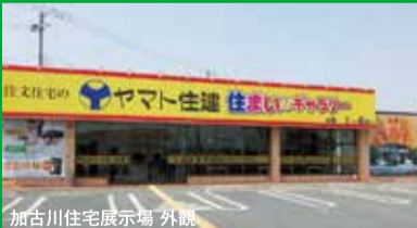
加古川住宅展示場 外観