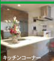
キッチンコーナー