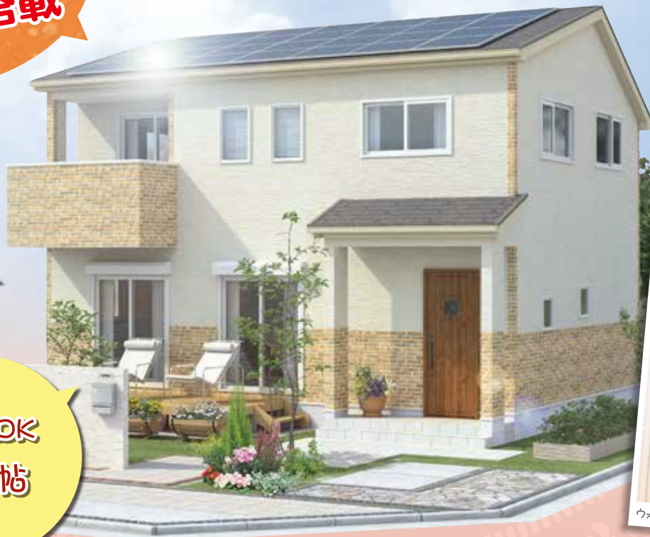
*画像はすべてイメージです。今回の見学会のお宅とは異なります。