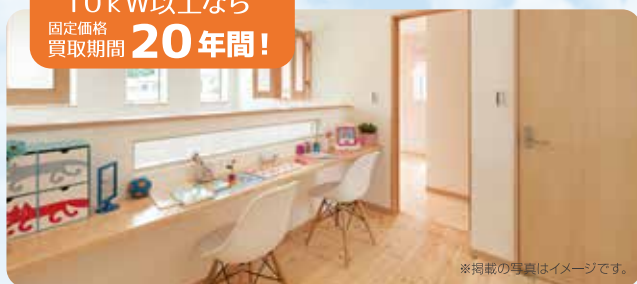
※掲載の写真はイメージです。

子育てや家事を楽しみたい。ペットを飼ったり、趣味を楽しむゆとりが欲しい。思い描くのはそんな暮らしではないでしょうか。おひさまハウスなら、売電収入で住宅ローンを軽減することが出来ます。生活をもっと楽しく!おひさまハウスはこれからの暮らしを応援します。