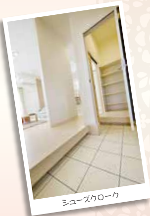
シューズクローク