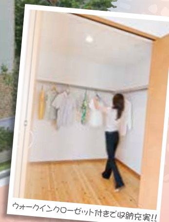
ウォークインクローゼット付きご収納充実!!