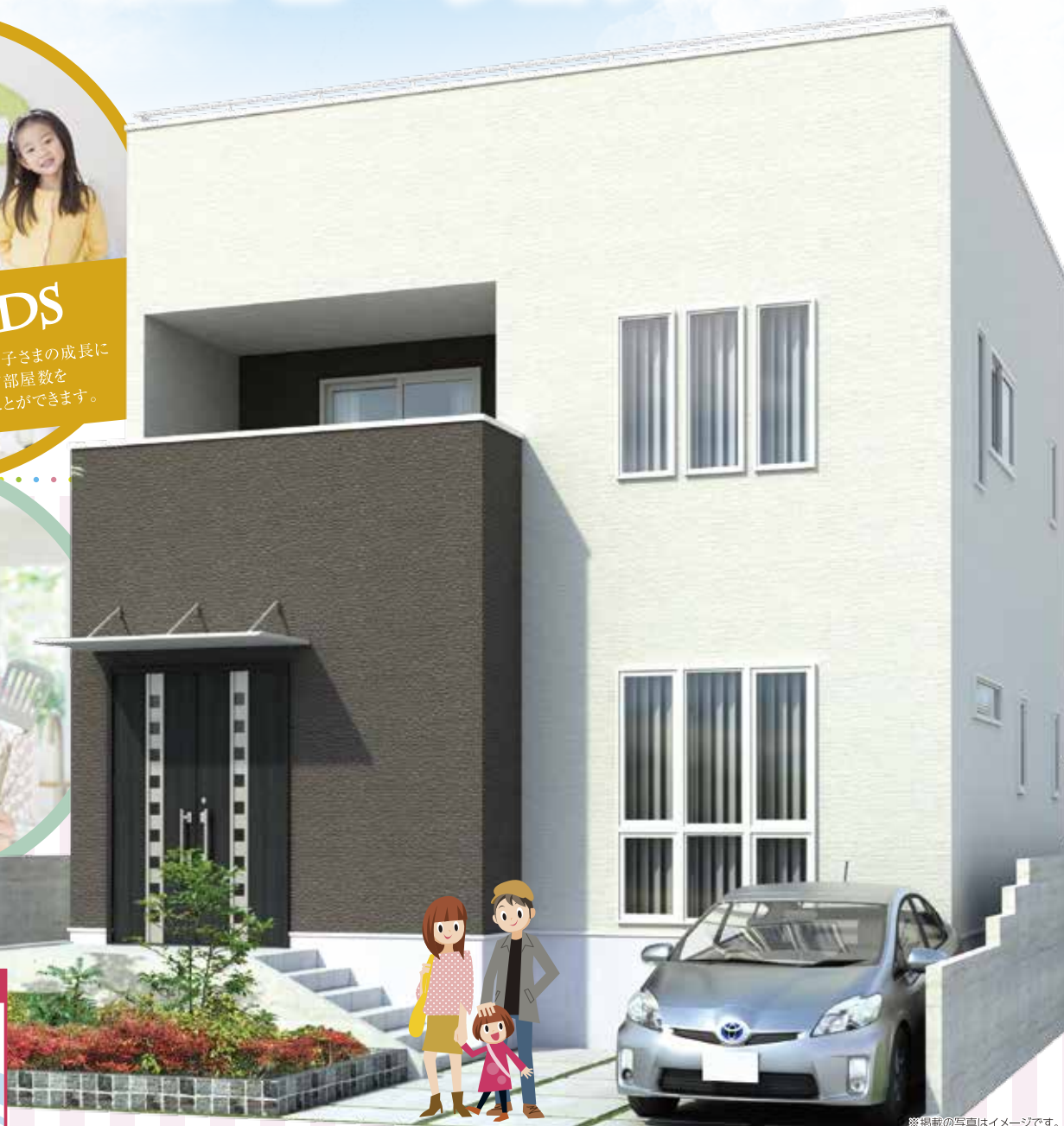
※掲載の写真はイメージです。