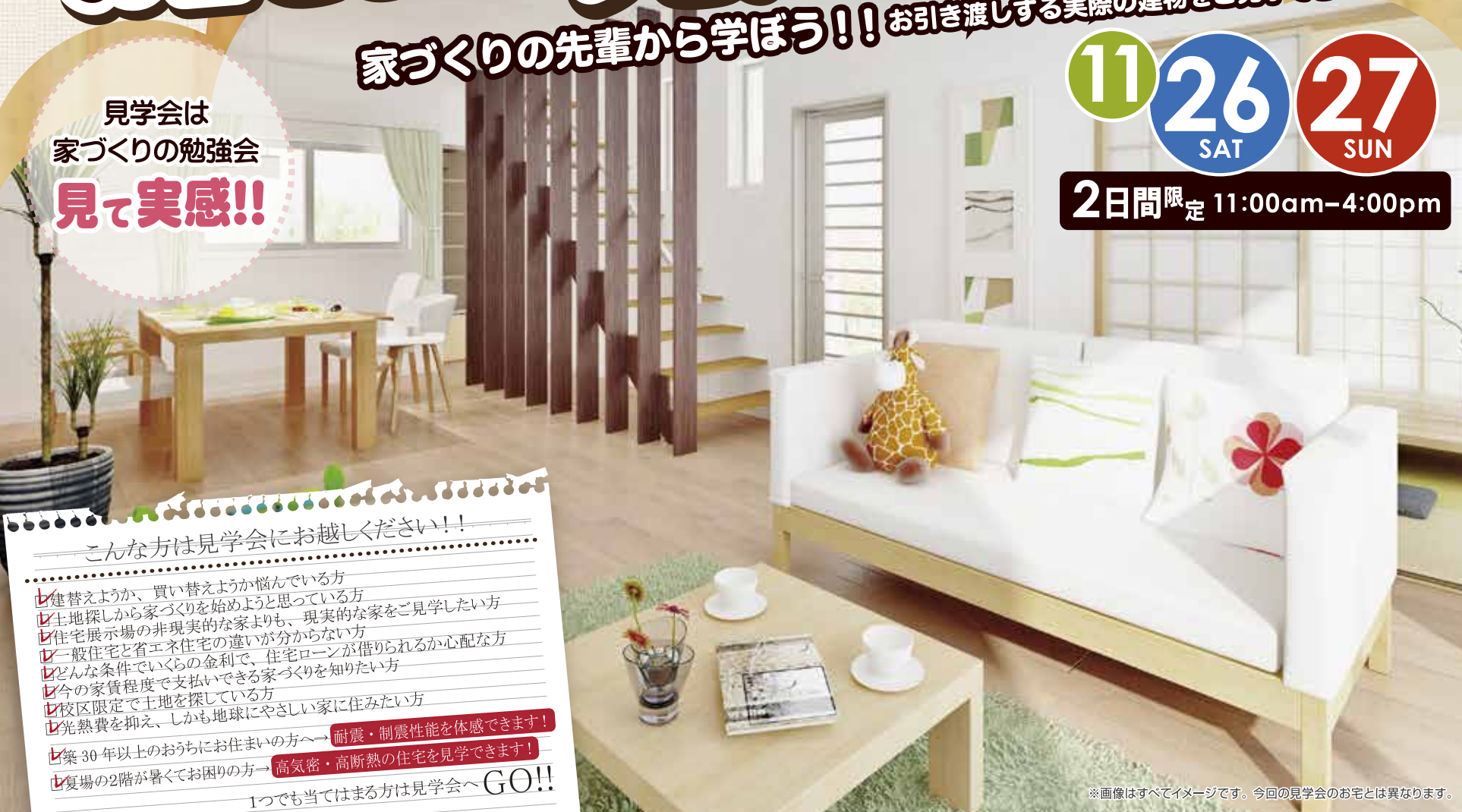
※画像はすべてイメージです。今回の見学会のお宅とは異なります。