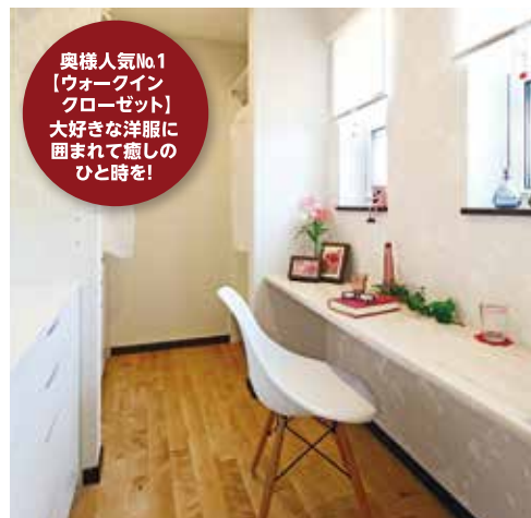
奥様人気No.1 【ウォークイン クローゼット】 大好きな洋服に 囲まれて癒しの ひと時を!