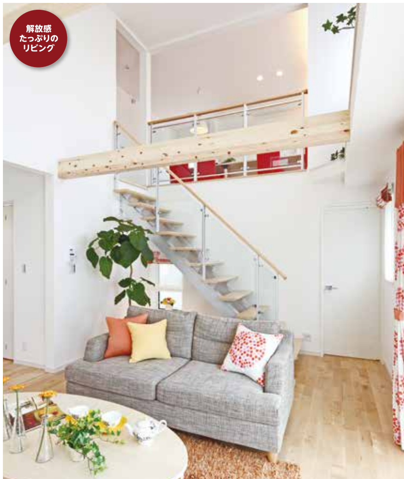
解放感 たっぷりの リビング