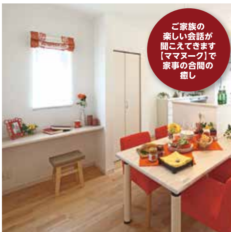
ご家族の 楽しい会話が 聞こえてきます 【マママーク】で 家事の合間の 癒し