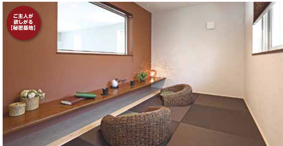
ご主人が 欲しが る【秘密基地】