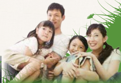
※画像はすべてイメージです。今回の見学会のお宅とは異なります。