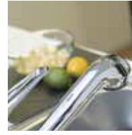
電気・ガス・水道の開栓・閉栓