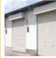
トランクルーム手配