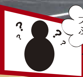
フワフワふうせん