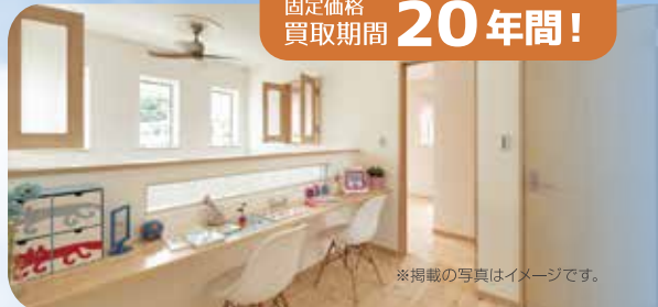
※掲載の写真はイメージです。