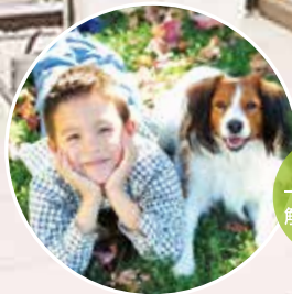
ペットと一緒に自然と触れられます